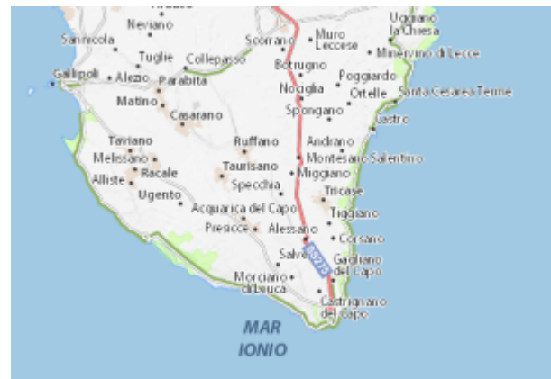
Il Salento sud

In Italia, un Paese ricco di diversità geografiche e culturali, emergono luoghi ai margini dell'attenzione collettiva che custodiscono autentiche e intricate narrazioni. Questi luoghi narrano storie che si estendono dalle valli e montagne alpine alle regioni interne dell'Appennino e alle isole del Mediterraneo.